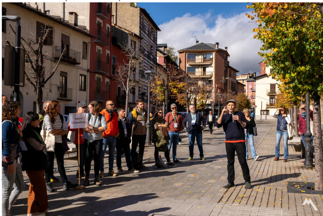
Imatge 05: Les participants posicionant-se segons els 4 àmbits destacats per aquestes jornades

Després de moure tot el grup de participants des del Museu Comarcal fins al l'Arxiu Comarcal, les facilitadores van convidar a les persones assistents a situar-se en un sociograma viu. Ubicant-se al pati davant de l'Arxiu, les persones es van posicionar a l'entorn de l'espai segons la seva comarca d'origen, fent servir cartells indicant les direccions cardinals Nord, Sud, Est i Oest, amb un pal amb el cartell indicant la Seu d'Urgell al centre. Posteriorment, es va convidar a tothom a presentar-se. Es va convidar les participants a observar quines veus estaven presents i quines faltaven. Per exemple, no hi havia persones presents de la Vall d'Aran, tot i que hi havia com a mínim 2 persones fins a 10 persones de cada altra comarca.