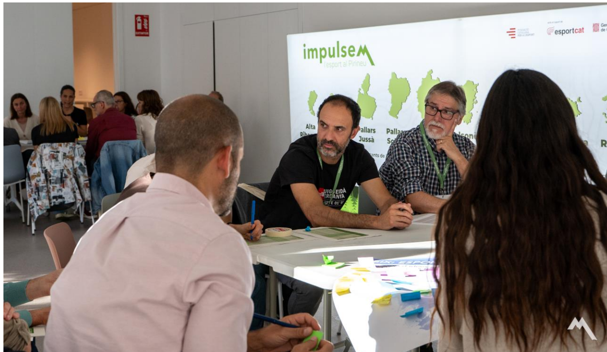
Imatge 10: Els grups de treball segons els àmbit d'enfocament de les jornades

Un cop presentat el concepte de Punts Palanca segons l'Iceberg, les facilitadores van explicar la dinàmica de cocreació dels objectius per eix. Es va demanar a les persones que es posessin per grups segons els eixos d'interès: Turisme, Ensenyament, Esport i Competicions i Serveis Públics.