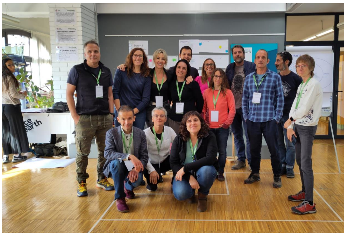
Imatge 13: Les persones que agafen la custòdia (requadre al fons a ma esquerra) i les persones que agafen un rol de suport (requadre més ampli) del sector de TURISME