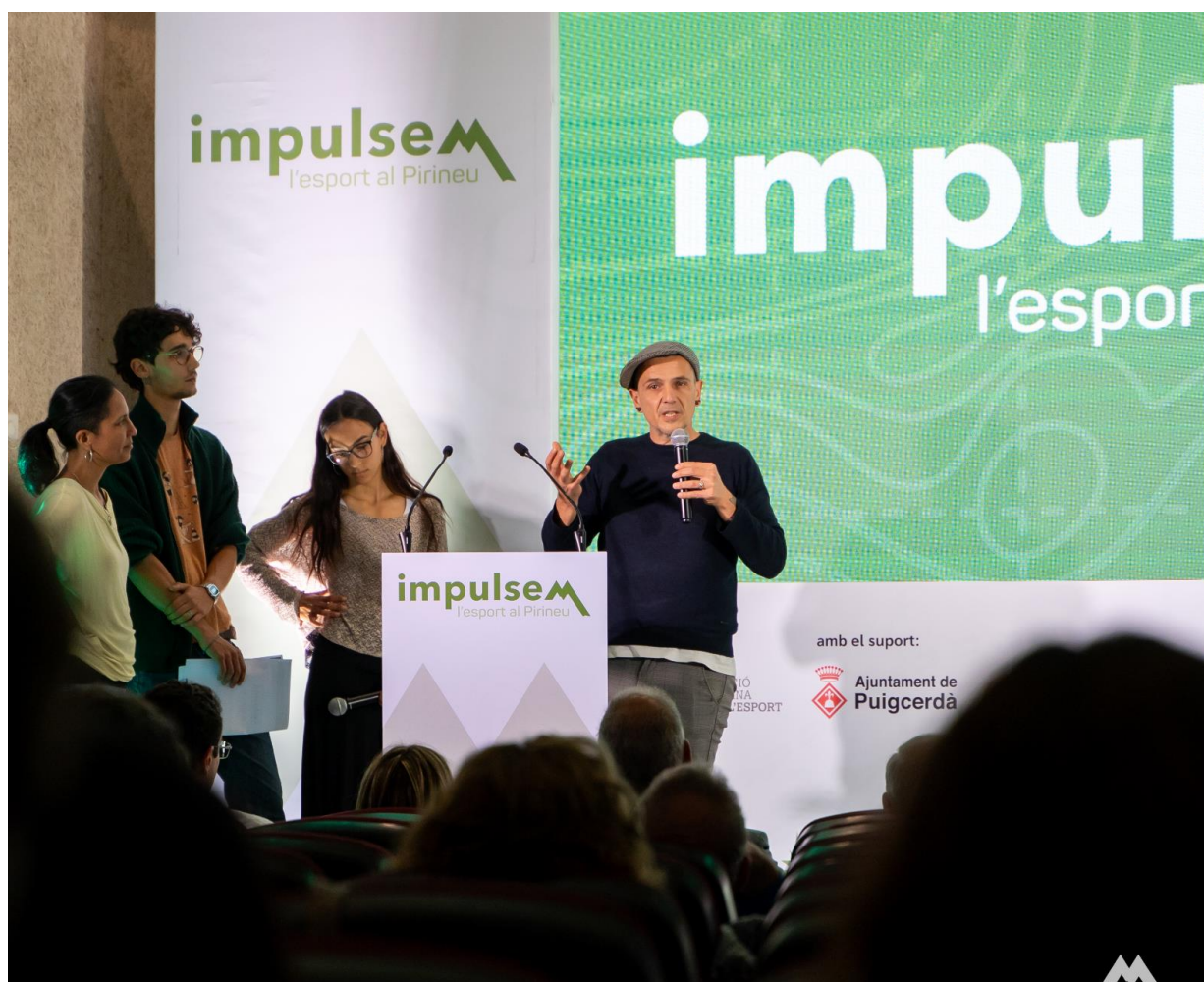
Imatge 15: L'equip facilitador de la cooperativa sense ànim de lucre, Resilience.Earth, compartint el resum de la coproducció estratègica realitzada al llarg de les jornades per les participants

Com a properes passes, es va compartir que cada àmbit té una proposta d'agents que poden i volen custodiar la implementació de les propostes generades, i amb les quals la Fundació hi pot comptar per seguir elaborant el futur pla estratègic del sector. També es va fer referència als plans estratègics actuals que poden compaginar amb aquest futur pla estratègic del sector de l'esport i el turisme esportiu als pirineus catalans, com són el Pla Estratègic dels Pirineus i Agenda Rural entre d'altres.