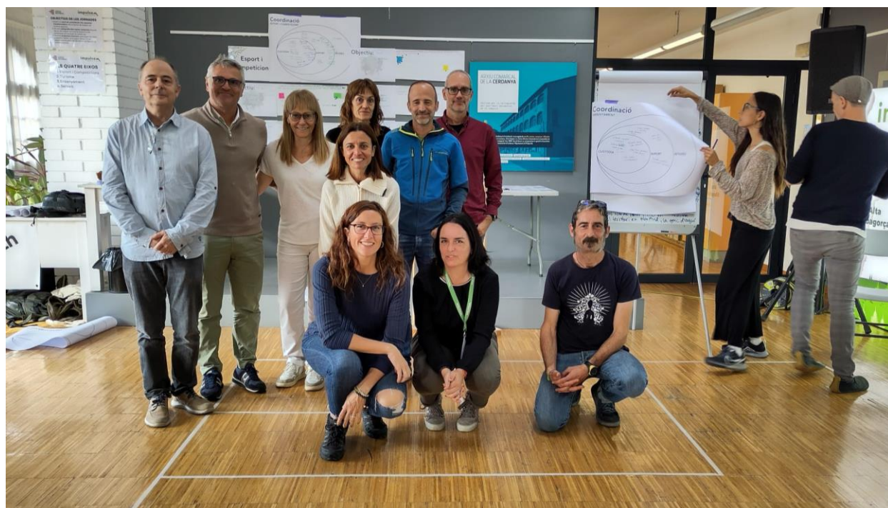
Imatge 14: Les persones que agafen la custòdia (requadre al fons a ma esquerre) i les persones que agafen un rol de suport (requadre més ampli) del sector d'ENSENYAMENT