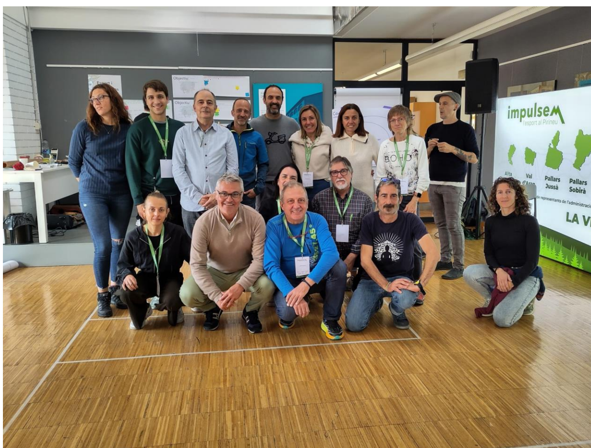
Imatge 12: Les persones que agafen la custòdia (requadre al fons a ma esquerre) i les persones que agafen un rol de suport (requadre més ampli) del sector d'ESPORTS I COMPETICIÓ