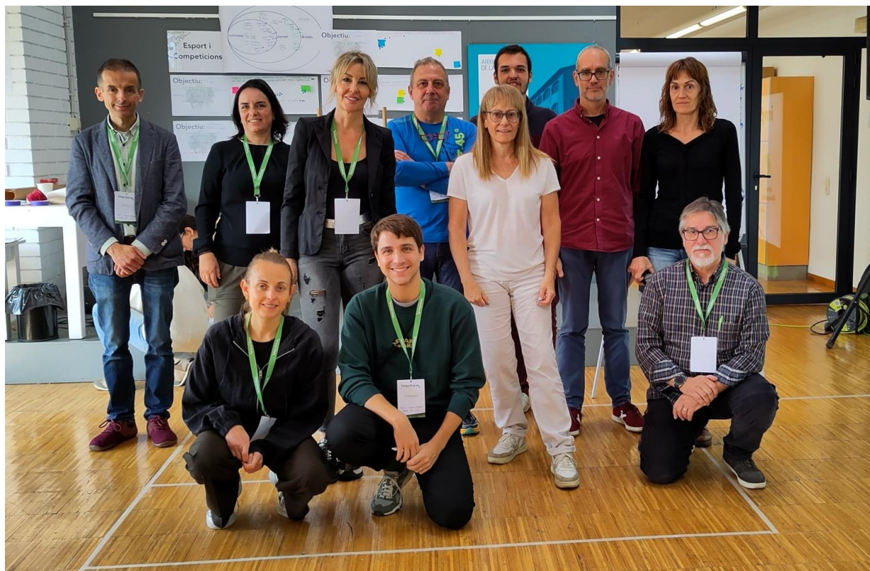
Imatge 15: Les persones que agafen la custòdia (requadre al fons a ma dreta) i les persones que agafen un rol de suport (requadre més ampli) del sector de SERVEIS