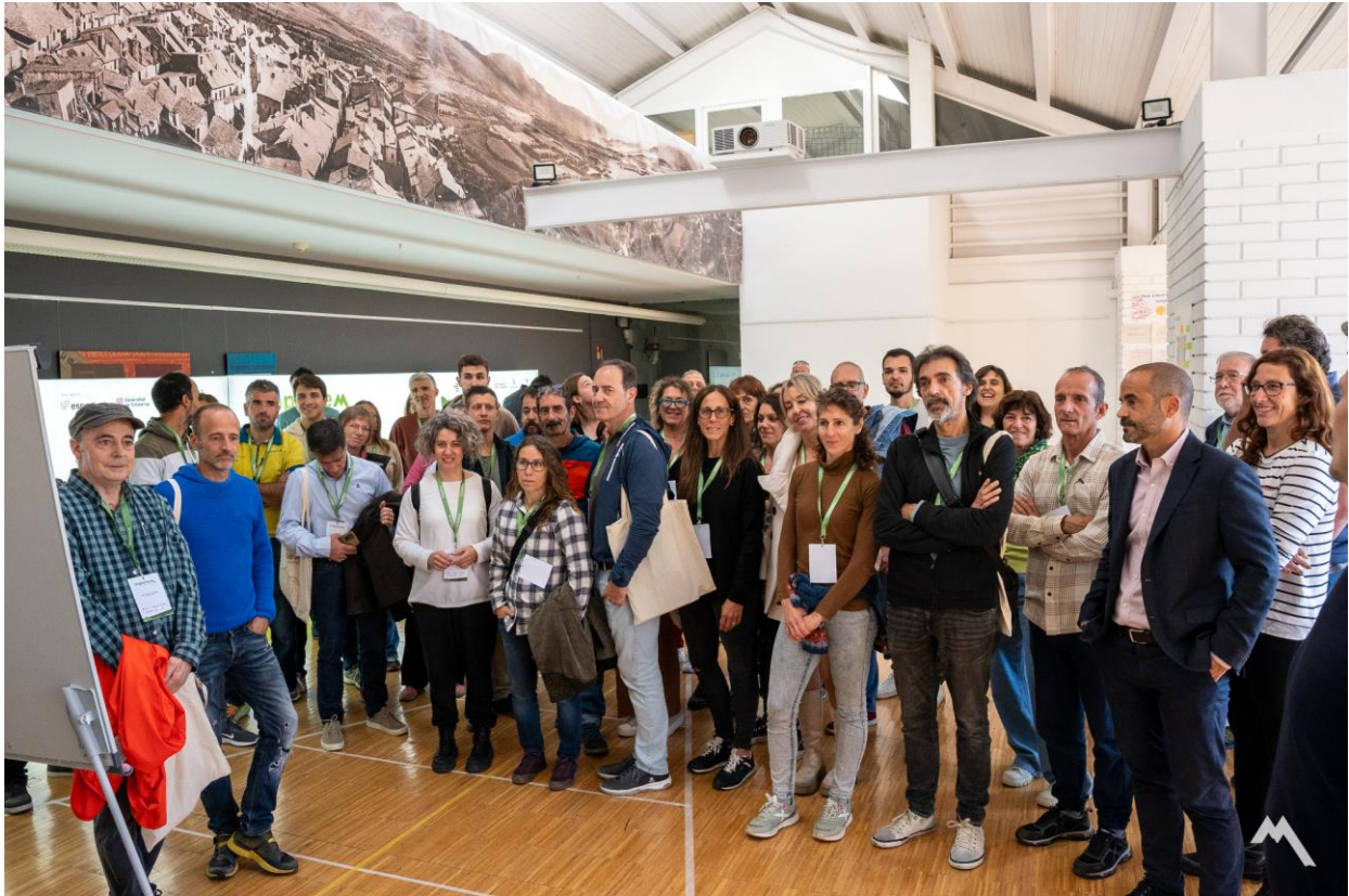
Imatge 06: Les participants ubicant-se segons el seu acord amb el nou propòsit del sector de l'Esport i Turisme Esportiu del Pirineu català